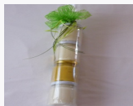
Krenstängla 4 x 50g 3.60EUR